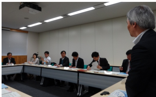
第二部 ネットワーク会議