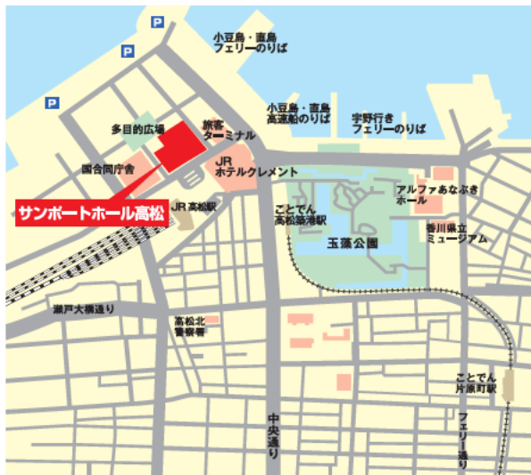
サンポートホール高松・案内図