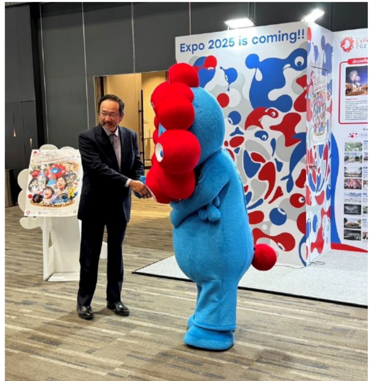
右の写真は大鷹駐タイ日本国大使とミyakumiyaku