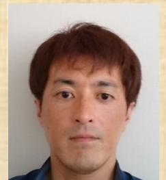
下田品質管理室長