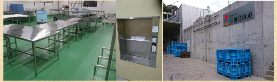
復旧後の加工場と修繕した設備