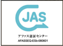
生産情報公表JASマーク