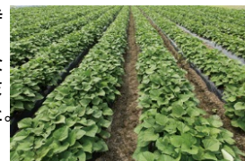
(株)さんわ農夢 サツマイモ農場

さんわ農夢(株)は、田をさつまいも栽培に適するよう独自に開発した土壌改良材を使用し、熟成させると糖度が約35度になる高品質で栄養豊富なさつまいもを栽培しており、取引先の評価も良好である。今後、地域内での生産量の増加が見込まれ、販路拡大が必要となっていることに加え、田で作るさつまいも「弘法の恵」「夢の芋」の認知度向上が課題となっていた。そこで、これらの課題を有する各者が、それぞれの経営資源を持ち寄って連携し、本事業に取り組むこととなった。